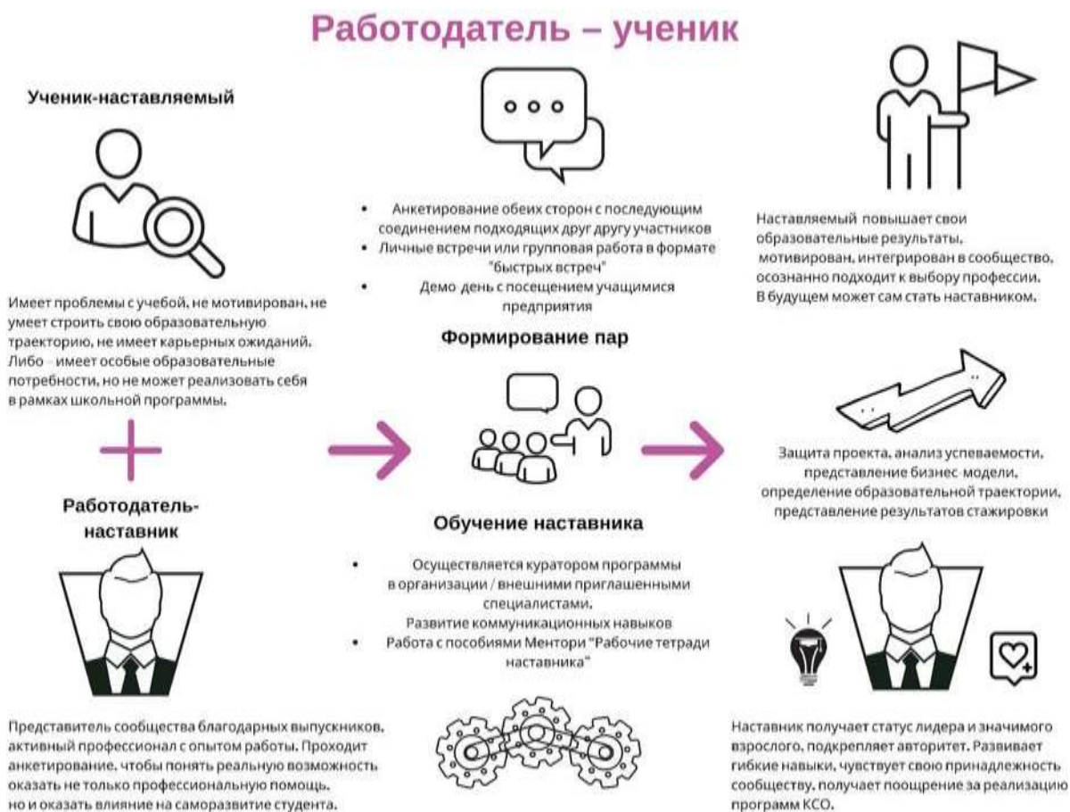
Рисунок 4. Графическое представление наставнического взаимодействия по форме «работодатель – ученик»