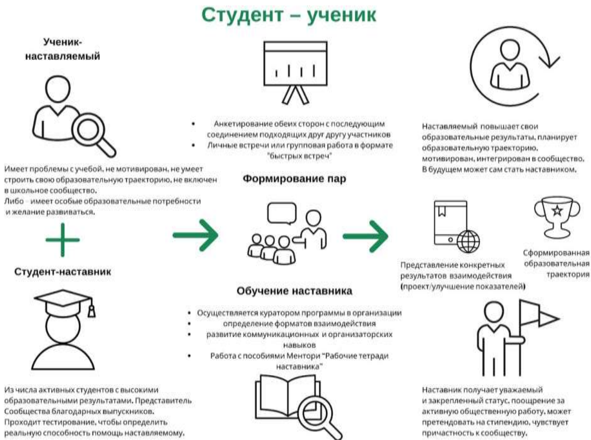
Рисунок 3. Графическое представление наставнического взаимодействия по форме «студент – ученик»