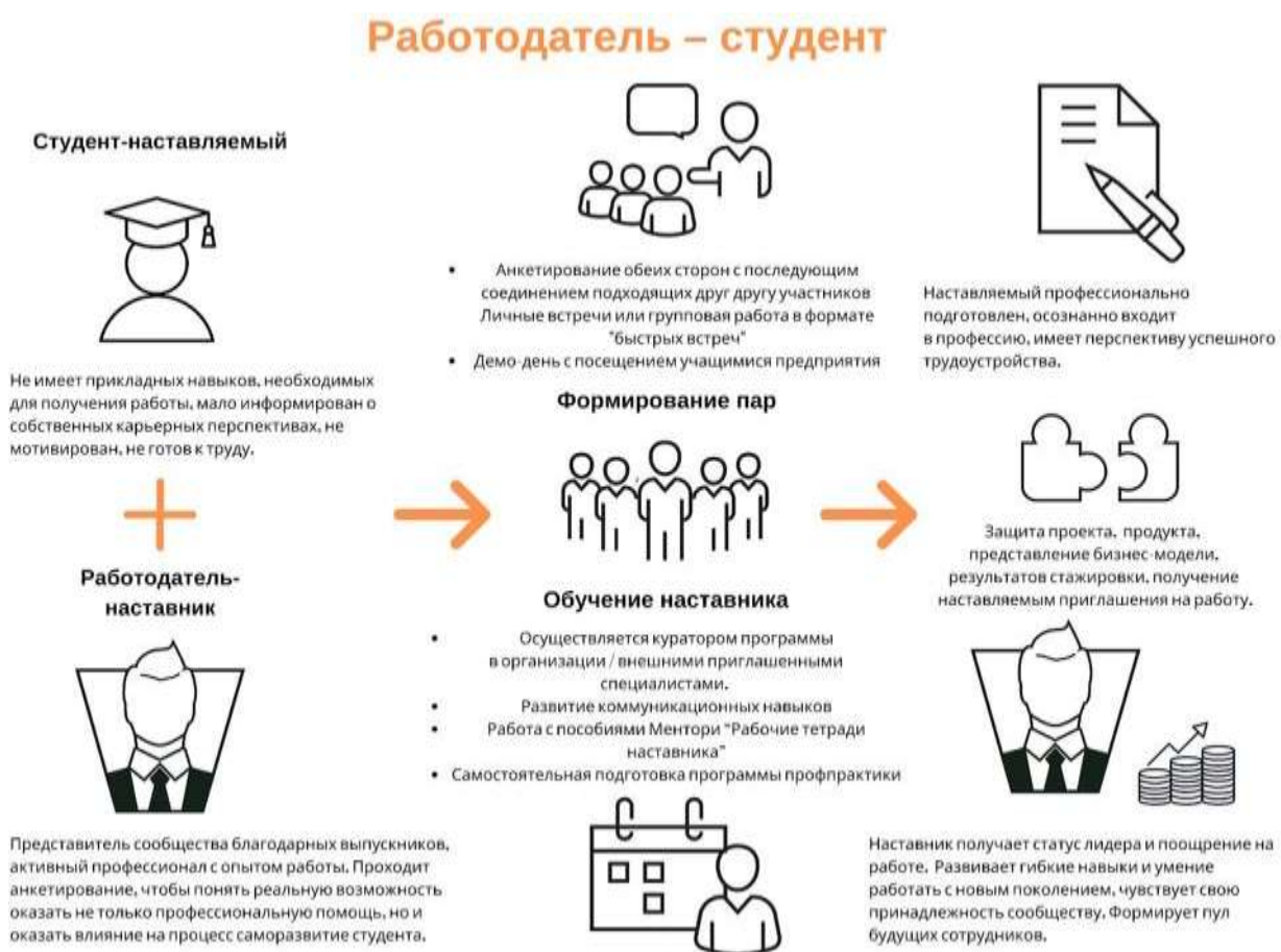
Рисунок 5. Графическое представление наставнического взаимодействия по форме «работодатель – студент»