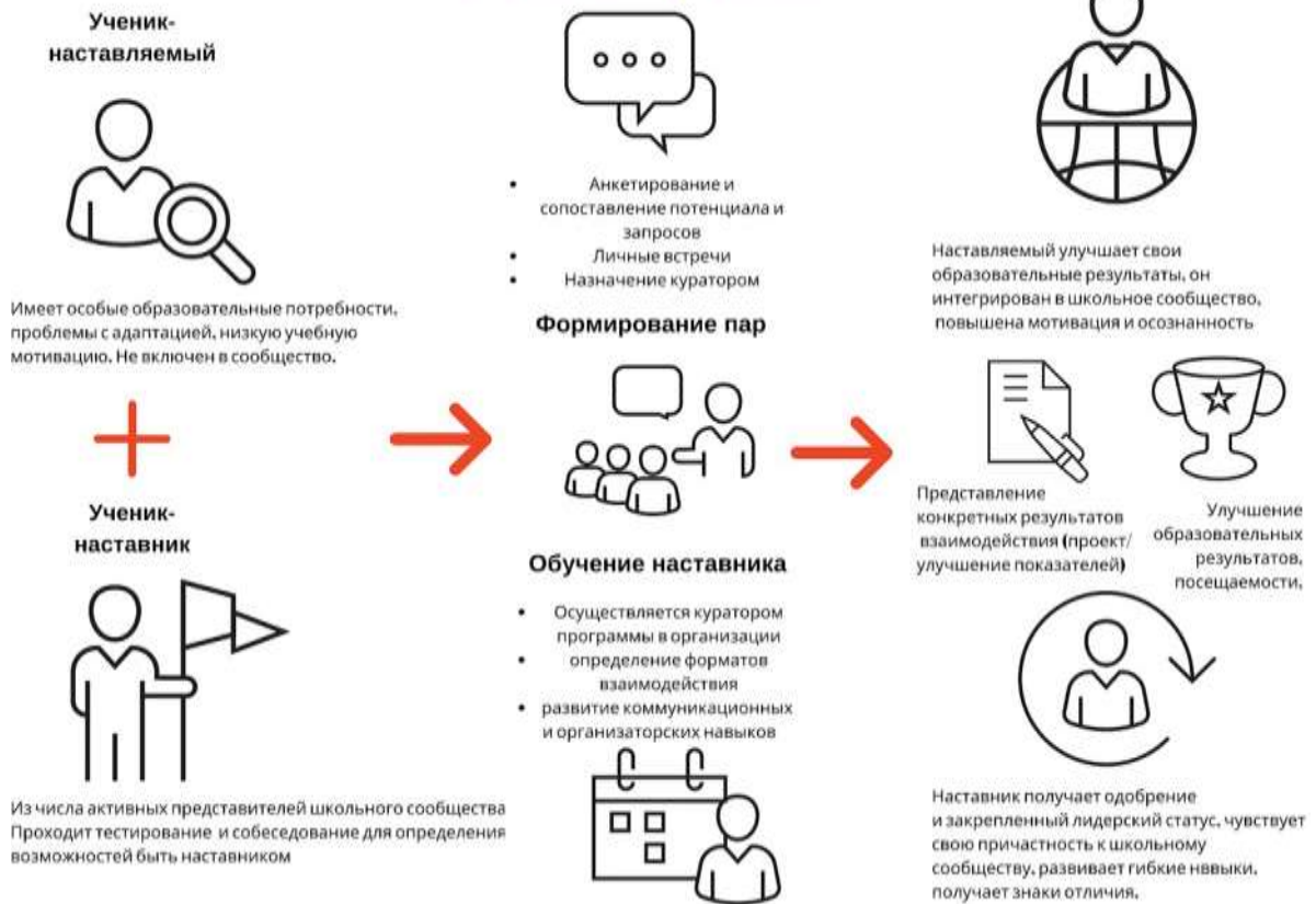
Рисунок 1. Графическое представление взаимодействия по форме «ученик – ученик»