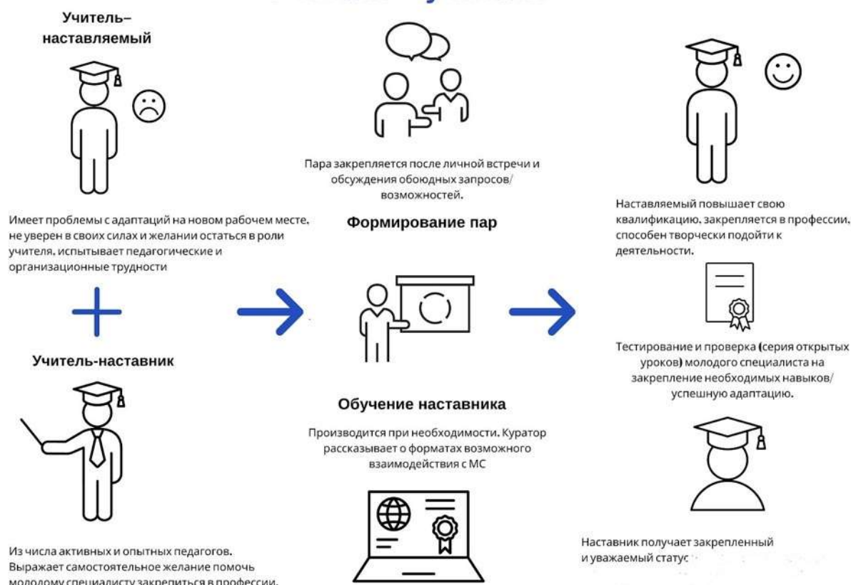
Схема реализации формы наставничества «Учитель - учитель»